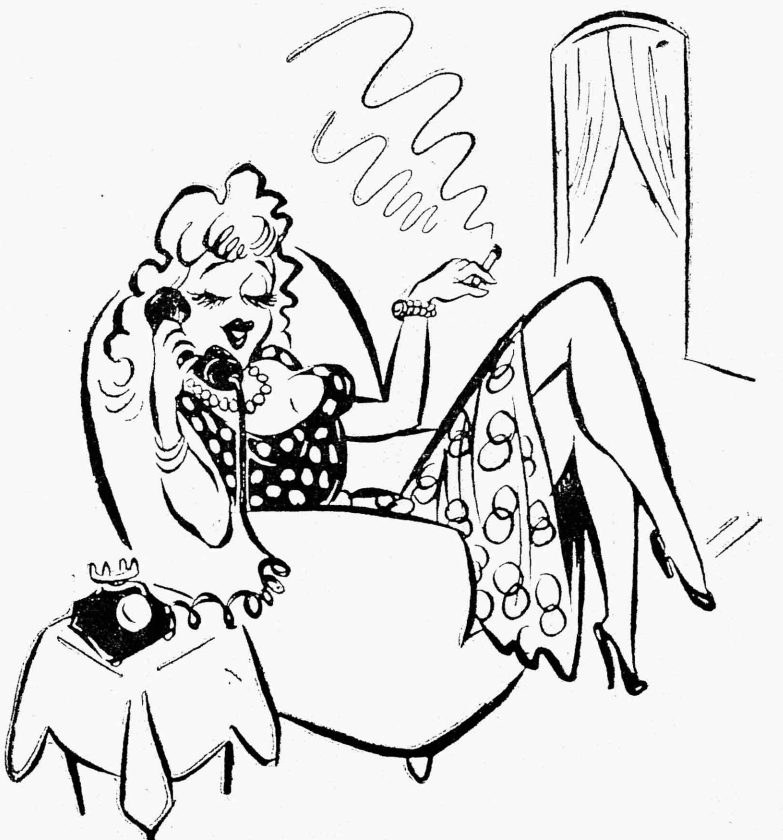
- بالله يا اختي تعملشي علي مزية تنعتني على عنوان الطيب اللي عمل عملية لحمايك المشومة القرومة وماتت بالعملية ؟