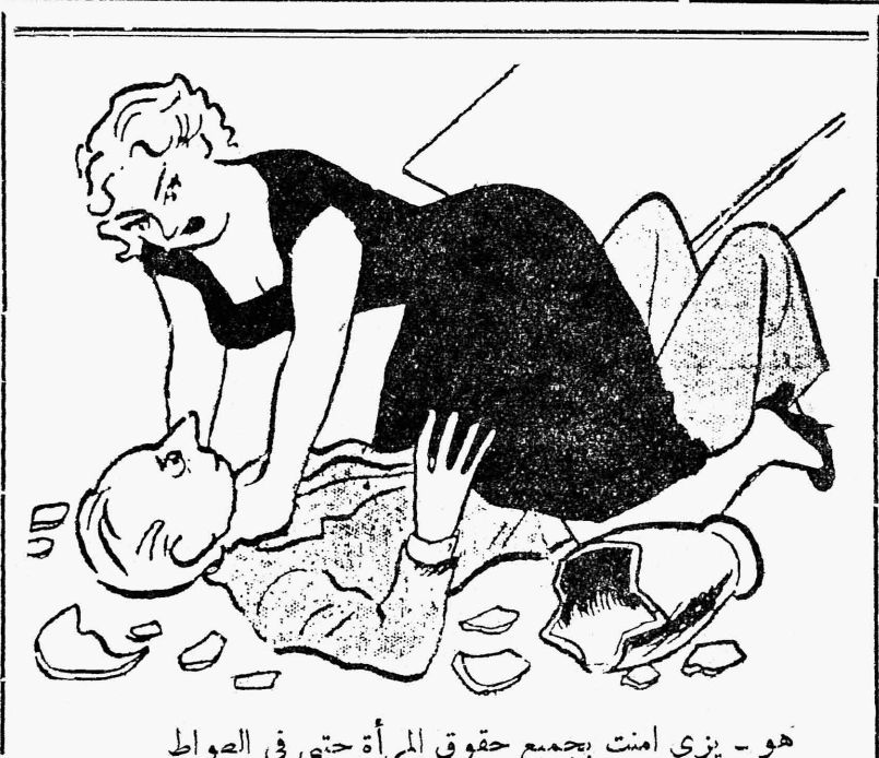
هو - يزي امننت بجميع حقوق المرأة حتى في العواظ

وعلى ذكر مشاغل الحكومة يطيب لنا ان نستعرض بعض ما انجزت هذه الحكومة الحازمة :